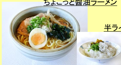
半ライスセット +165円