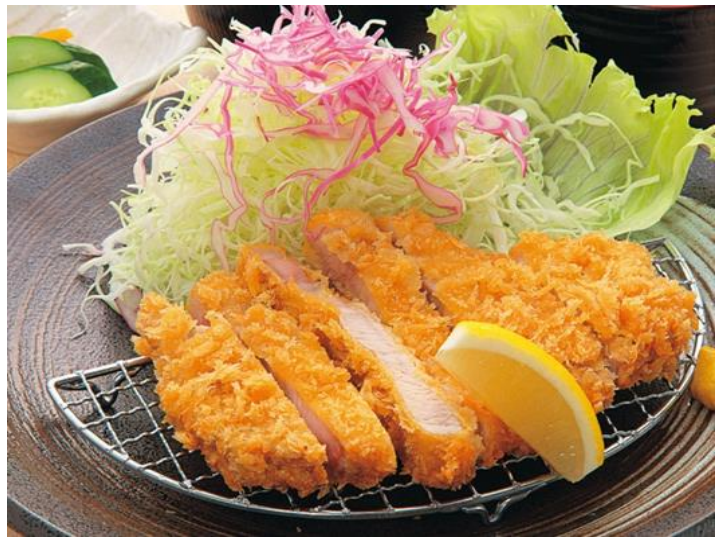
もち豚のロースカツ膳