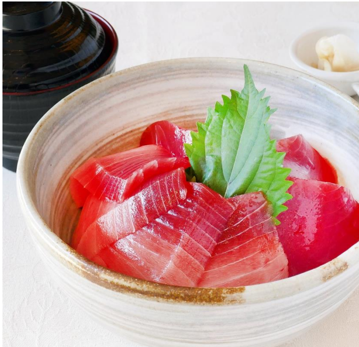
厳選された天然南鰯 まぐろ鉄火丼