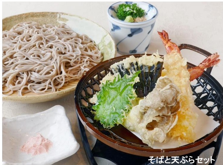
そばと天ぷらセット